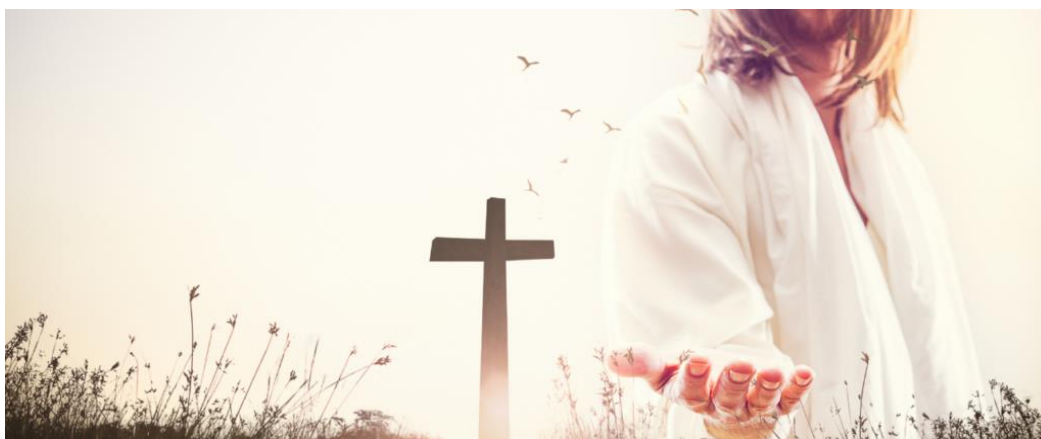
The Passion, 17 april Terneuzen

Met het landelijk evenement 'The Passion' komt het paasverhaal bij miljoenen mensen in de huiskamer. Een missionaire kans!