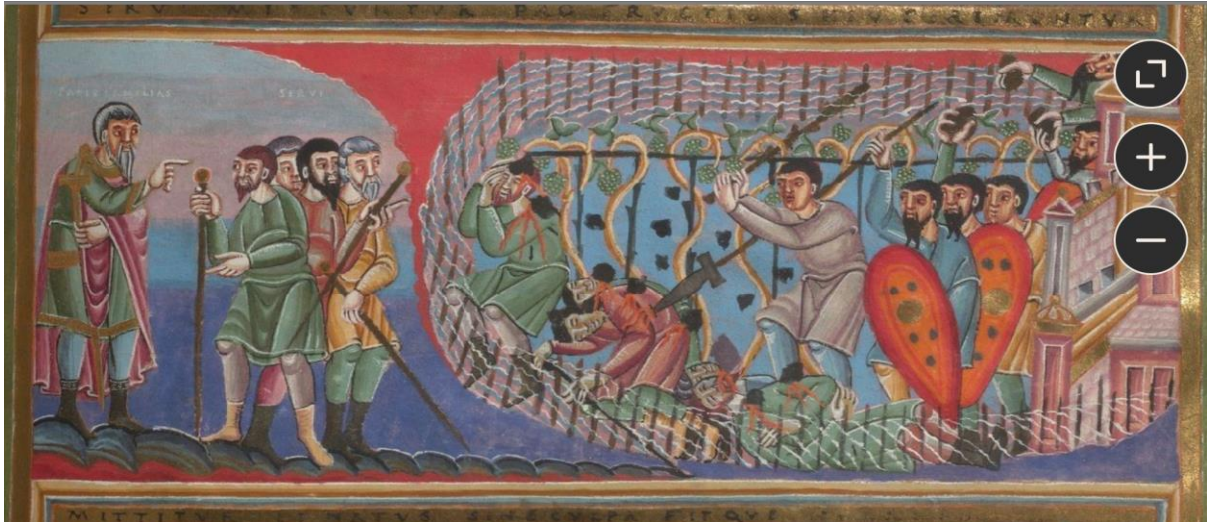
De slechte pachters, afbeelding uit de Codex Aureus Epternacensis.